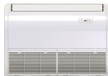
AVT52 Vloer/Plafond Unit